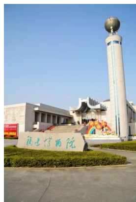
福建博物院