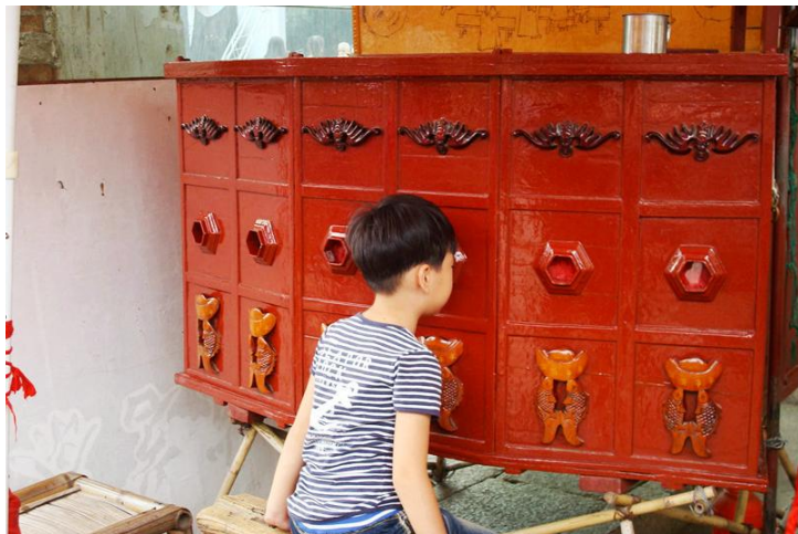
西洋镜 by 愉快的屁股