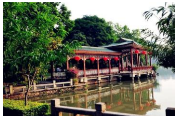
西湖公园

交通：乘坐109、111、139、142、1、810、811路公交车在西湖公园站下车即可。