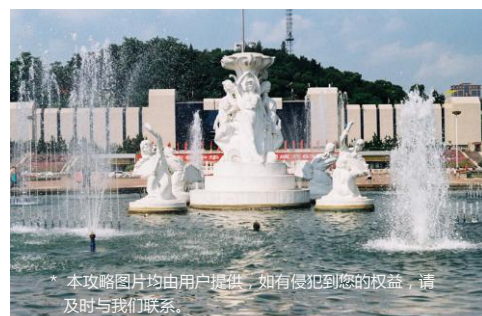
* 本攻略图片均由用户提供，如有侵犯到您的权益，请及时与我们联系。