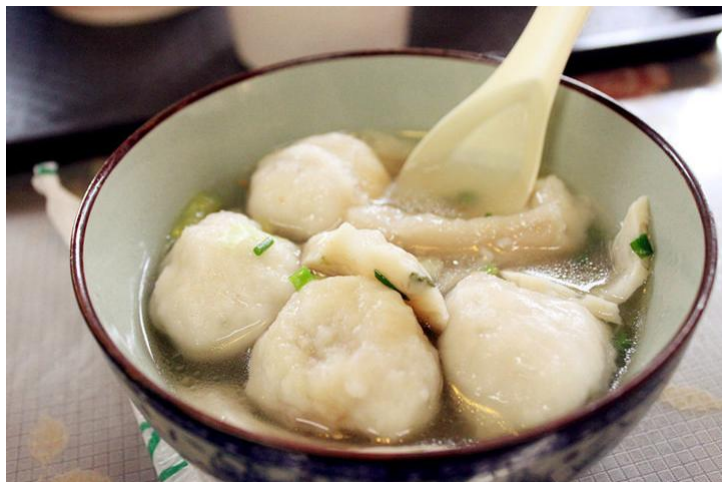
鱼丸 by 愉快的屁股