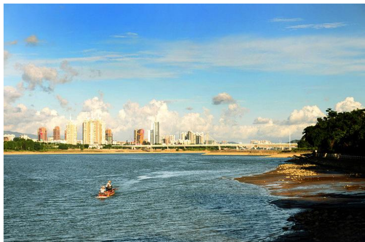
闽江 by 斯瓦洛