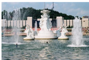
五一广场 by 愉快的屁股