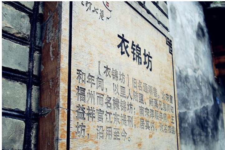
衣锦坊 by 愉快的屁股

三坊七巷，纵横交错，白墙瓦屋，曲线山墙。这里是“明清建筑博物馆”，也是“城市里坊制度的活化石”。