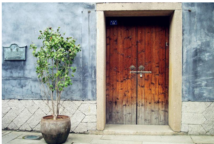
三坊七巷 by 愉快的屁股