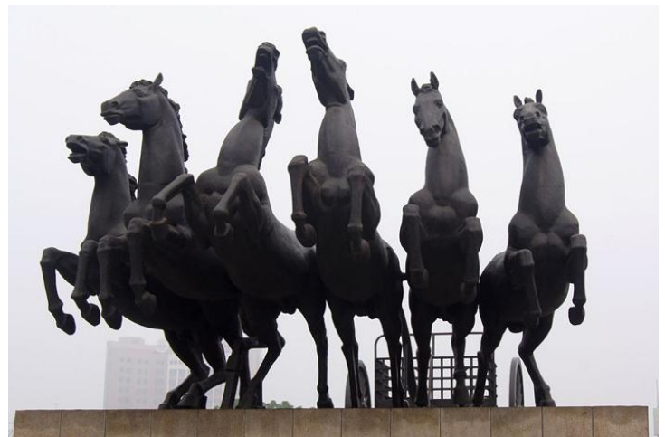
天子驾六