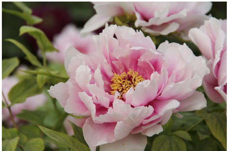
牡丹花 by 游云徒