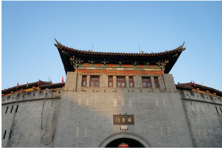
丽景门 by aileen_djw