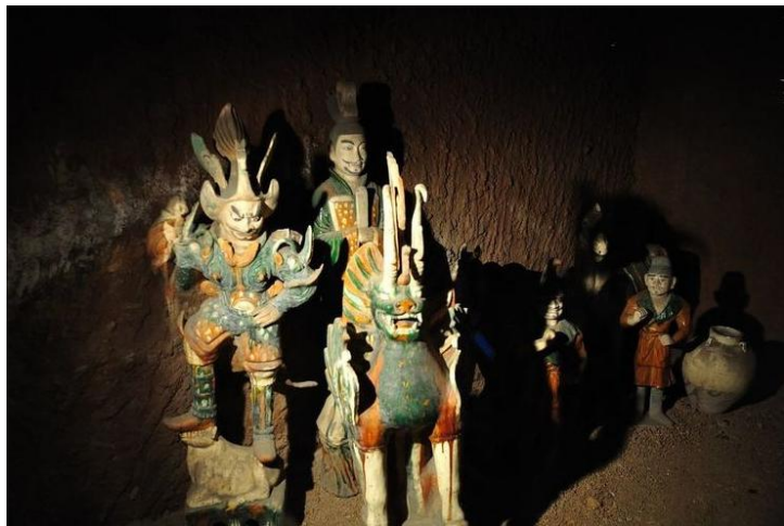
唐三彩 by Genius_Liyan