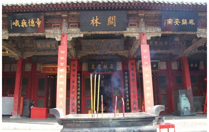
关林 by 游云徒