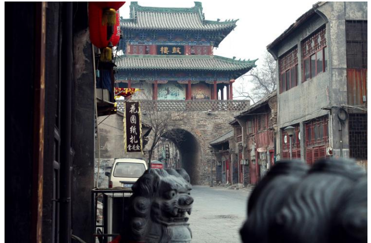
洛阳老街 by 贰叁叁