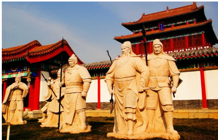
三国英雄 by chenhui314159

当你看到埋葬关羽首级的关林时，“温酒斩华雄”、“兵败走麦城”的故事总让人忍不住为一代豪杰感叹。