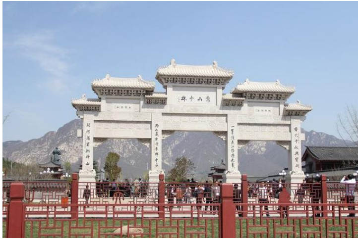
高山少林 by 游云徒

少林寺，位于中国河南省郑州市登封的嵩山，是少林武术的发源地，禅宗祖庭，由于其坐落嵩山的腹地少室山下的茂密丛林中，所以取名“少林寺”。少林寺在唐朝时期，享有盛名，以禅宗和武术并称于世。民国时期被军阀石友三几乎焚毁殆尽。现任少林寺方丈是释永信。