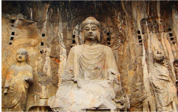
龙门石窟

相传卢舍那大佛按武则天的相貌雕凿，所以佛像威严中有几分女性的圆润，想来，一代女皇定是绝代佳人。