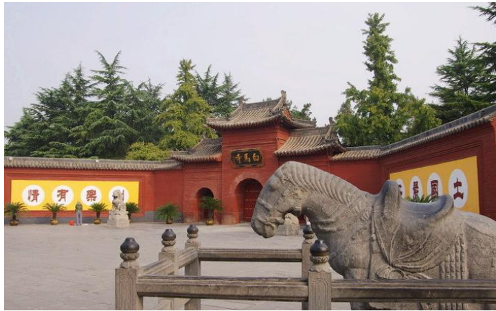
白马寺 by 悠悠的国