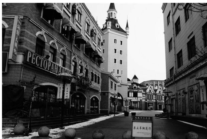
北戴河建筑 by 爱到茶米