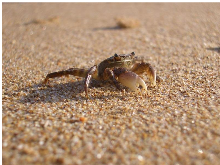
小螃蟹 by 瑶兔兔