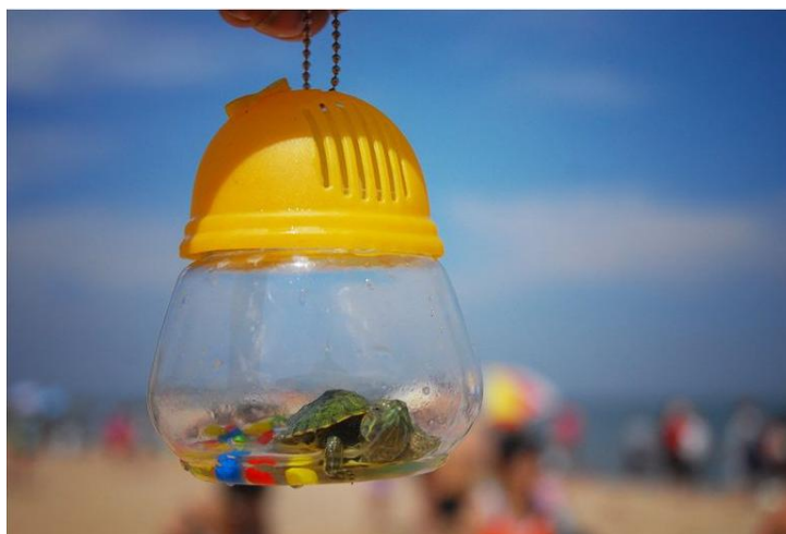
小龟 by Forsandy01