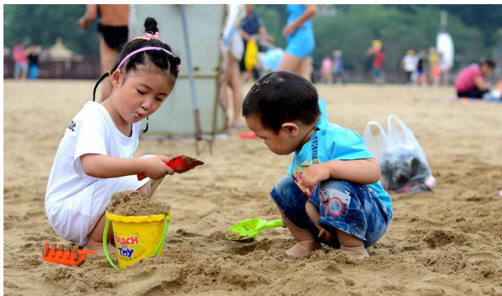
老虎石玩沙

看海，玩沙，挖贝壳，寻海星，晒太阳.....在沙滩总有做不完的事啊。海边拍骚照，顿时觉得pose不够了，各种摆型，尽情撒野吧！