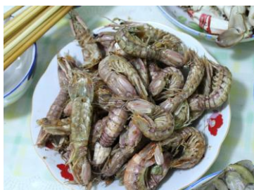
皮皮虾 by gmchen

北戴河的皮皮虾很新鲜，可以买新鲜的自己租个小屋做，生的约11-18元/斤，也可以出钱让饭店加工，旅游旺季比较贵。如果直接在景区的饭店点皮皮虾这道菜，那就是天价了。