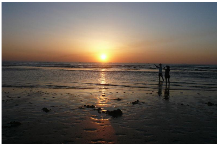
鸽子窝日出 by 烟灭就分手008