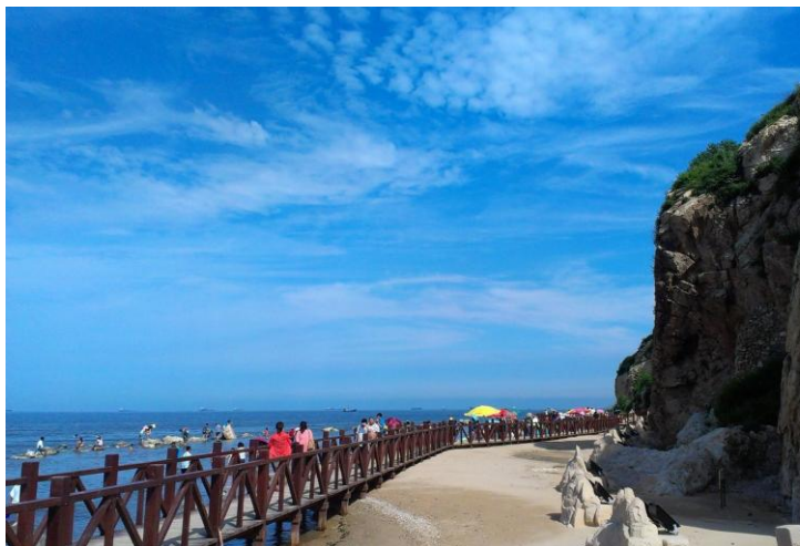
鸽子窝 by 一月如星

下午乘公交前往碧螺塔海公园，晚餐在公园附近解决，凭门票可以二次入园，晚上还有丰富的表演可以欣赏。