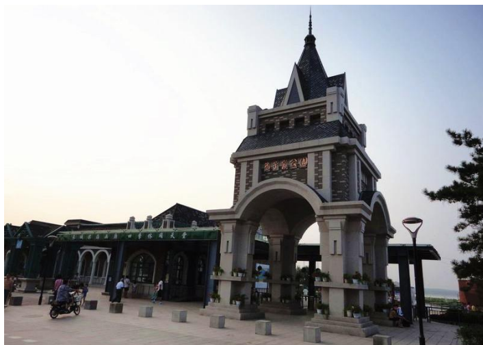
鸽子窝公园 by meteorlin333