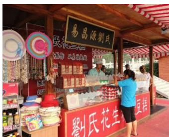
花生绿豆糕 by meteorlin333

绿豆糕有不同口味，现场制作免费品尝，花生绿豆糕类似北京花生糖差不多味道，约25元一斤。