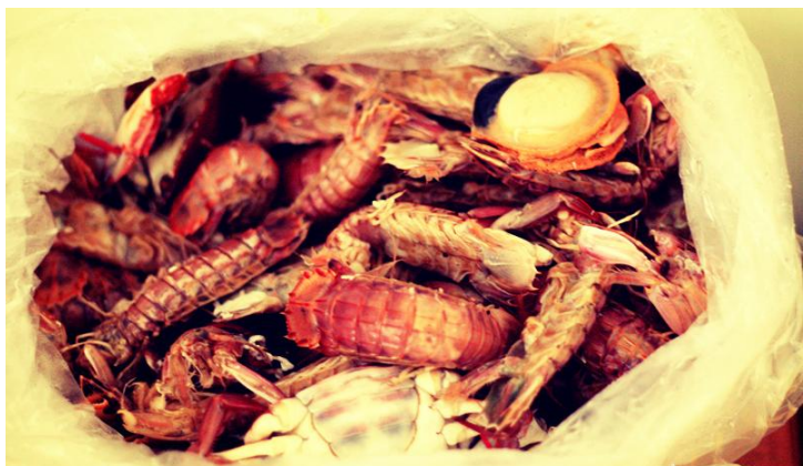
皮皮虾+螃蟹+扇贝 by piparain

到市场买上两斤鲜活的海鲜，找个地方简单加工，坐在海边，品尝这大海的馈赠。鲜，鲜，鲜，鲜到骨子里！