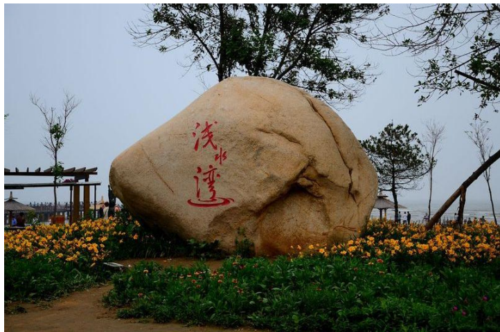
浅水湾 by coolui