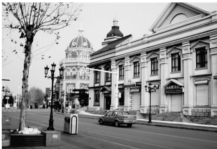
北戴河街道 by 爱到茶米