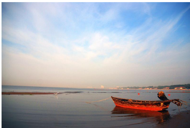
平静的沙滩 by Forsandy01