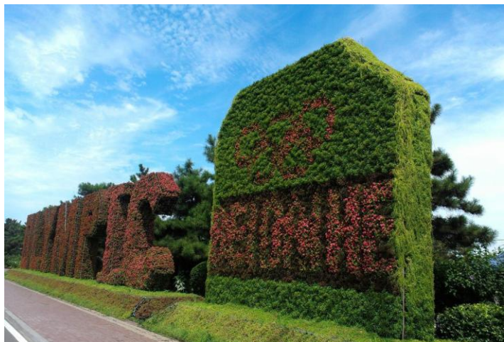
奥林匹克大道公园