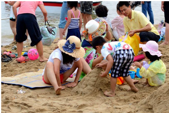
沙滩欢乐何其多