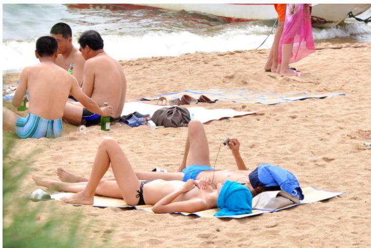
沙滩日光浴