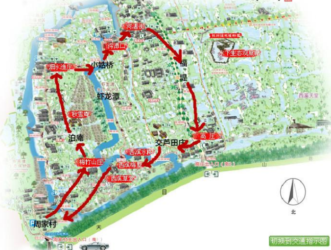
路线图 © 2009.xixiwetland

这条路线的亮点在于几乎所有景点都涉及到了，而且这条线路主要是领略古镇的感觉。在步行途中，到了吃饭时间，可以和家人或爱人在水边觅一处花丛，以蓝天为顶，绿草为毯，百花为屏，虫鸟为伴，摊开准备好的野餐布，拿出家中带来的各式美味，吃上一顿风味独特的花下野餐，这样一定会使你情趣大增、胃口大开。而且途中还顺便游览了杭州湿地植物园，一举两得。