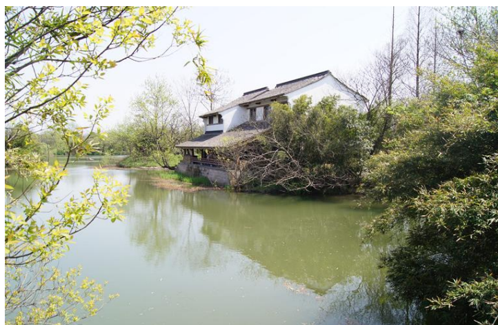
西溪湿地一角 by 可牛11

“曲水弯环，群山四绕，名园古刹，前后踵接，又多芦汀沙渚”，这就是西溪湿地，坐落于杭州市区西部、占地面积10.08平方公里的中国第一湿地园，它独特的风光和生态，吸引了成千上万的游客。湿地内河流众多，水渚密布，温度适宜、雨量充沛，植被繁多，大面积的芦荡，众多飞禽走兽，到处鸟语花香，空气清新。在西溪，你可以泛舟湖漾港汊，可以垂钓河塘柳荫，秋风中可以观柿听芦，冬日可以探访梅花，也可以在初春时踏青漫步，在夏日下采菱赏荷，其中的野趣妙意，真是令人流连忘返。