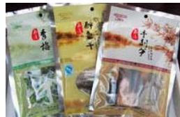
西溪三宝

西溪三宝包括西溪青梅、醉鱼干和笋干。这些都是西溪独有的特色，一定要亲自尝一尝，即是品尝过后发现可能没什么特别之处，也请不要后悔哦，因为这是西溪村民劳动的成果。