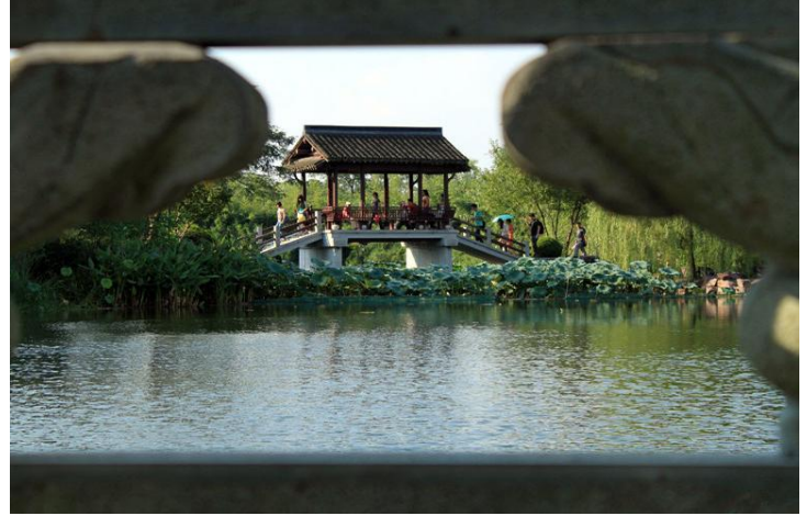
石桥 by 寒水776