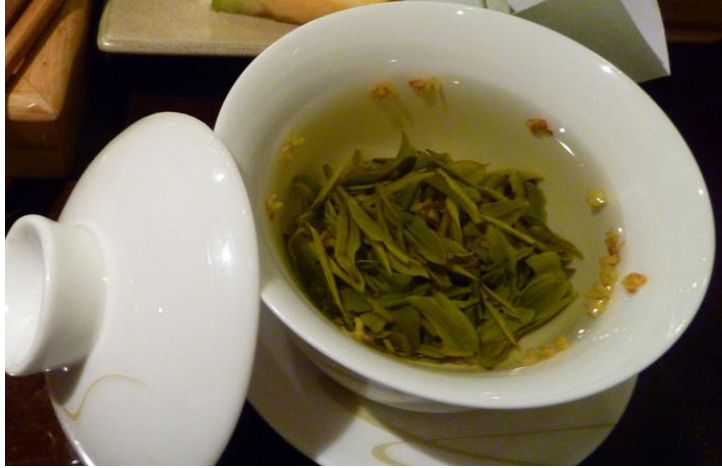
西溪大碗茶

西湖龙井茶名列中国十大名茶之首，中外皆知。但很多人不一定知道西溪茶叶，自古也有很高的声誉。白色瓷碗盛满茶水，色泽醇厚，入口甘甜，每碗售价1元，一定不要错过哦。