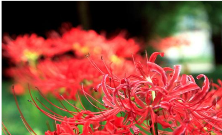
乱花丛 By 寒水776

和家人或爱人席地坐在乱花丛中，享受着美食和撩人的花丛，让你感觉像是身在世外桃源，没有了凡尘中的压力山大。