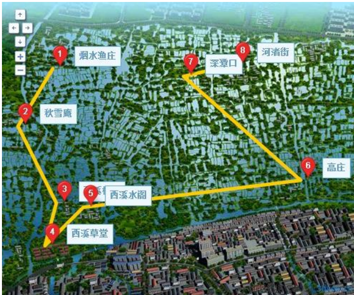
路线图 by 3D游网站

这条经典路线的亮点就在于一路水景，乘小舟顺着蜿蜒的水道前行，做一回世外仙人，感悟西溪独特的风韵。