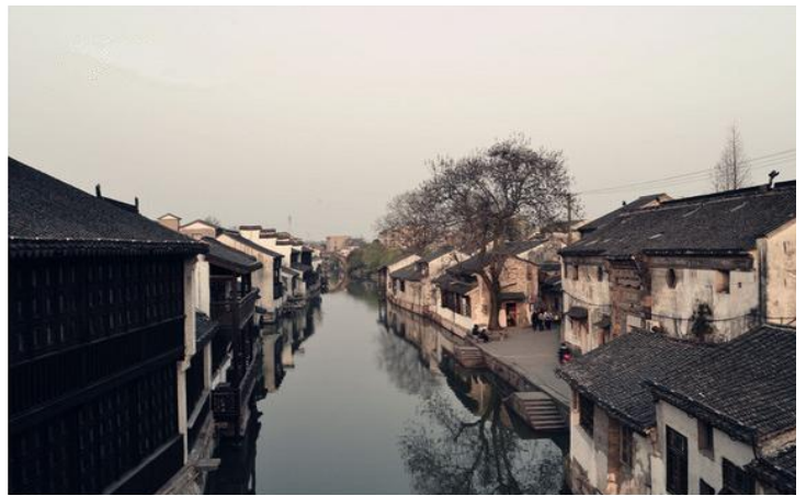
南浔古镇

“鱼米之乡”的南浔“耕桑之富，甲于浙右”、“丝绸之府”的南浔“无尺地之不桑，无匹妇之不蚕”、“文化之邦”的南浔“九里三阁老，十里两尚书”，在这里，名胜古迹与自然风光和谐统一，构成了一幅黛瓦粉墙绿柳拂水的江南水乡图。