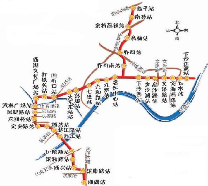
地铁图 by 杭州地铁官网

杭州地铁1号线于2012年11月24日正式运营。起步价为2元/人次，最高价为8元/人次。