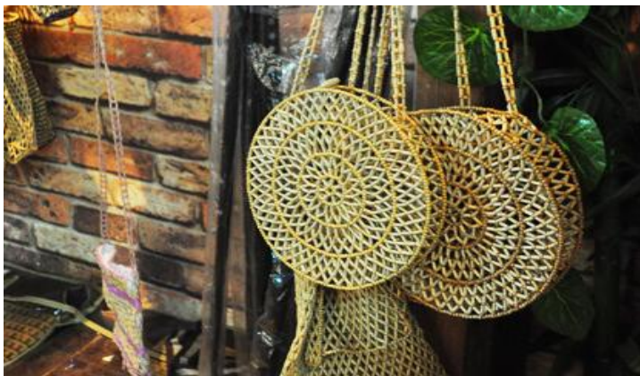
西溪小花篮

西溪小花篮已经被列为杭州市非物质文化遗产保护项目了。它独具西溪特色，也已经在做出口。而且现在会制作的人已经非常少了，可见它的独特之处。西溪小花篮有12个品种，包括五角星篮、皮包篮、发篮、六角篮等等。