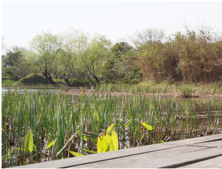
湿地植物园 by 可牛11

湿地植物园总占地约55公顷，在一片非常开阔的地带，坐在岸边，一边欣赏河面上各种水生植物，一边品着在河渚街买的麦芽糖，别有一番乐趣。据说现在植物园里有600多种植物，应该足够看了吧。