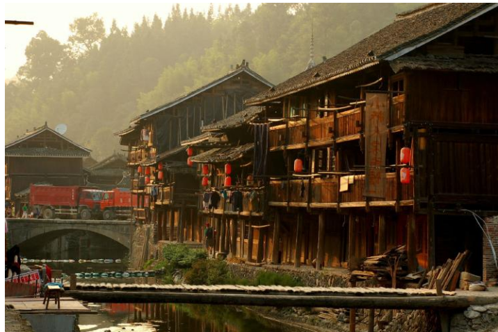
古老的侗寨吊脚楼