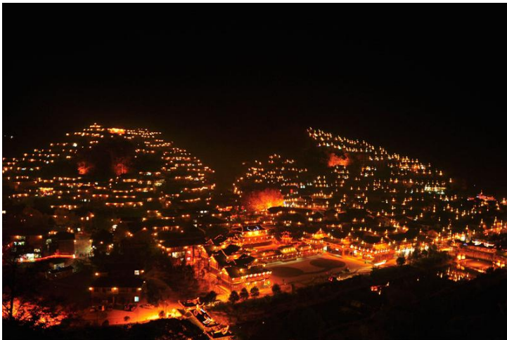
西江苗寨夜景 by 蓝月_玩转西部