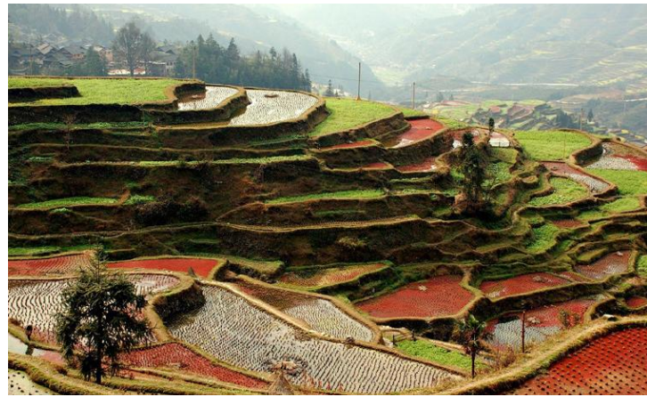
顺势而为的梯田

这些梯田中间均散落着苗乡独具特色的吊脚楼，犹如点缀在银河里的行星。逆光下的层层梯田有如面面明镜，一层层亮得耀眼，大者如曲池，小者似碎镜，依山势而层层弯曲，顺坡度而块块递进。