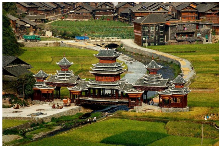
漂亮的风雨桥