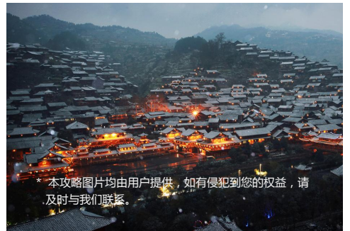
* 本攻略图片均由用户提供，如有侵犯到您的权益，请及时与我们联系。