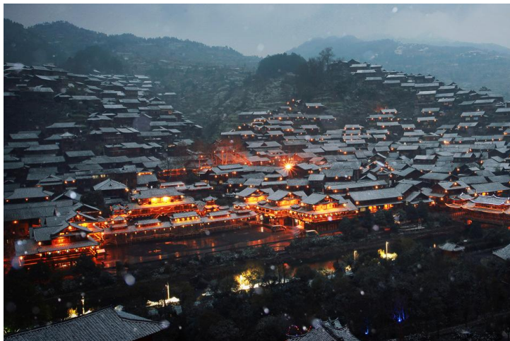
雪中的西江苗寨

西江有邮政储蓄和农村信用社，内均有ATM，支持银联卡取现，黔之驿精致旅舍里有农业银行的ATM取款机。西江是所有黔东南村寨中唯一——个有ATM的。