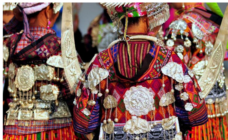
纷繁的装饰

服饰上的每一片绣片，银饰上的每一个构件都可以构成一份非物质文化遗产，这是苗族服饰银饰的最主要的特征之一。