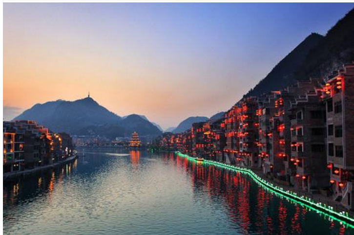
傍晚的镇远古城 by 叫我繆繆

历史悠久的古镇，依河而建，远观颇似太极图，融佛、儒、道三教文化内涵于一炉，各种古巷道、古民居、古码头相映成趣。