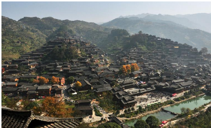
西江千户苗寨

中国最美的湖叫西湖；中国最美的女人叫西施；中国最美的寨子就是眼前的西江了。白水河蜿蜒而过，滋养着千户苗寨的世代子民。