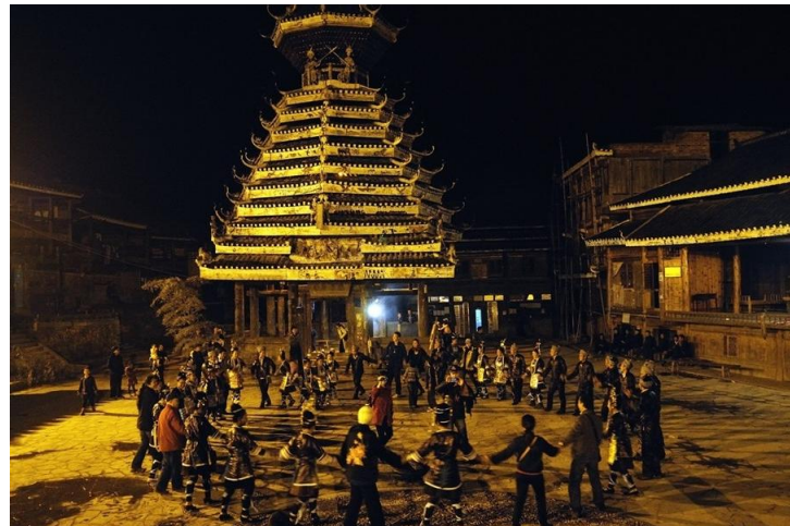
手拉手唱歌的人们 by alick_li

宰荡的精髓在于她的侗族大歌。如果说肇兴是黔东南旅行核心的话，宰荡在我们心中，是黔东南旅行的灵魂。