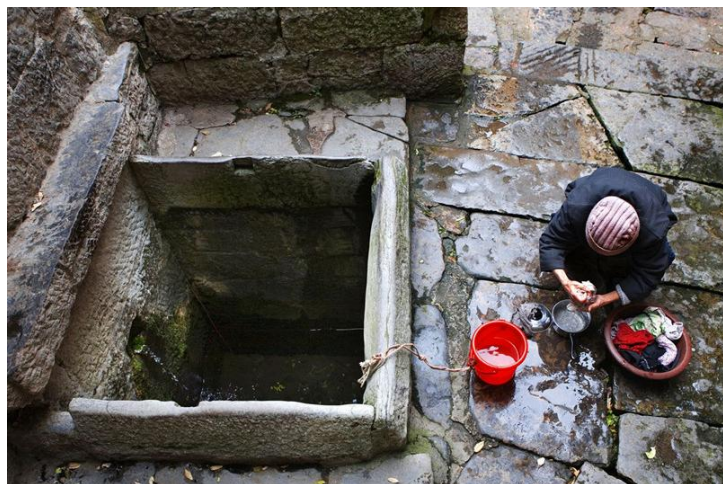
镇远四方井

这里的房屋造型和用途，别具一格，保留着传统干阑式风格和用途。在追求越洋越好的今天，不少地方洋房拔地而起，传统木房越来越少，木房面临消失。而该地仍保存清一色木房，并且是传统的干阑式房屋造型。