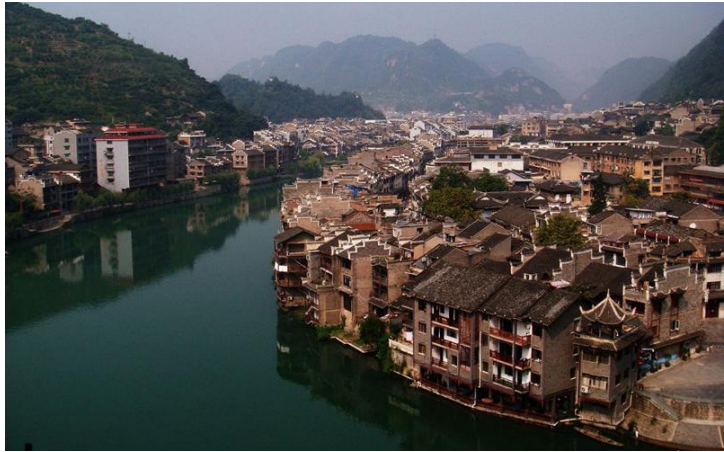
镇远古城 by 小艾的艾

晚上睡在河边的房间里，隔江架空铁道火车呼啸而过，在空中划出一道光线，像极了宫崎骏动画《千与千寻》中的空中列车。